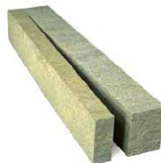
PAROC Linio 80