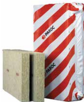
PAROC Linio 10, PAROC Linio 15