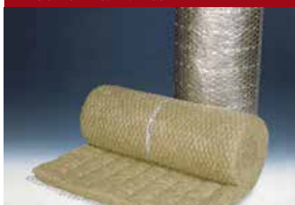
PAROC Pro Wired Mat 100 PAROC Pro Wired Mat 100 ALI