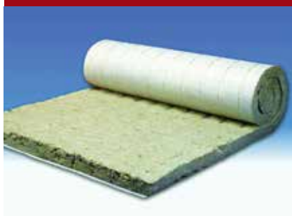
PAROC Pro Felt 60 N1