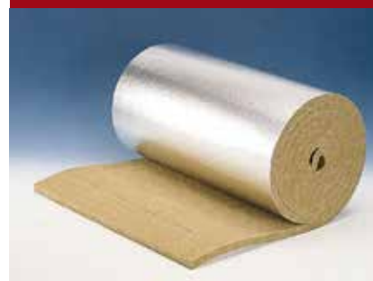
PAROC Pro Lamella Mat AluCoat

* Температура на поверхности фольги не более 80°C