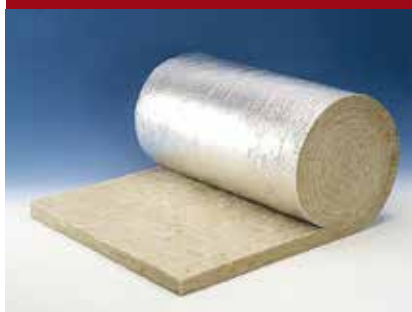
PAROC Hvac Lamella Mat AluCoat