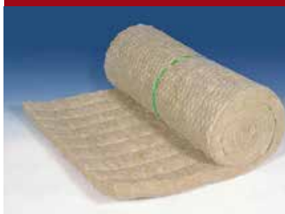
PAROC Wired Mat 65