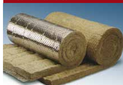
PAROC Pro Wired Mat 80 PAROC Pro Wired Mat 80 AL1